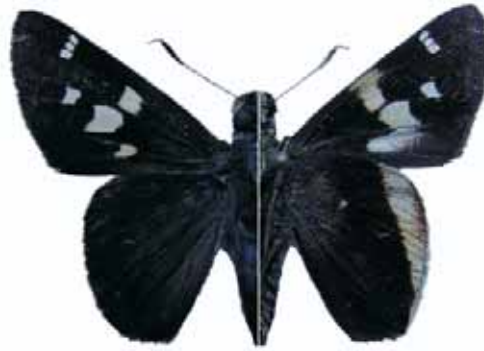
Figura 11. Vaceria hermesia hermesia (Hewitson, 1870) ♂

CAUCA: Santa Rosa, río Villalobos, 1300 m, 9-I-2009, 1 macho y 1 hembra (J. I. Vargas Col) CJIV-067.