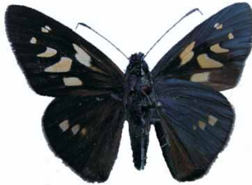
Figura 9. Saliana hewitsoni Riley, 1926 ♂

CALDAS: Riosucio, Cerro Aguacatal, 1500 m, 3-III-2008, 1 macho (J. A. Salazar Col.) CJIV-067.