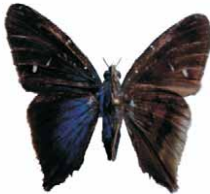
Figura 2. Astraptes egregius egregius (Butler, 1870) ♂ Género Diaeus Godman & Salvin, 1895

CALDAS: Marmato, Quebrada la Honda, 720 m, 1 macho, 10-I-2008 (J. I. Vargas Col.) CJIV-067 RISARALDA: Quinchia, Irra, Cerro la Cruz, 950 m, 1 macho, 7-VIII-2008 (J. I. Vargas Col.) CJIV-067. VALLE DEL CAUCA: Dagua, Atúncela 3°52.510'N 76°26.152'W 1535m 1 macho, 14-XII-2007 (E. Henao Col.) CEH-085. Tuluá, Vereda La Marina. Reserva Los Chagualos. 1400 m 1 macho. 8-IX-2008. (F. G. Gaviria Col.) CEH-085.