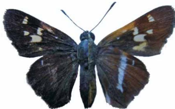
Figura 8. Oxyntes corusca (Herrich-Schaffer 1869) ♀

CALDAS: Manizales, Tres Puertas, Hacienda Pinares, 1060 m, 20-IV-2008, 1 hembra (J. I. Vargas Col.) CJIV-067