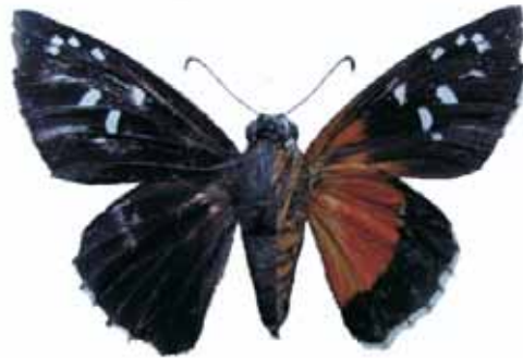
Figura 1. Melanopyge maculosa (Hewitson, 1866) ♀

CHOCÓ: San José del Palmar, Cañón del río Habita, 800 m, 1 macho, 9-VII-2002 (J.I. Vargas Col.) CJIV-067. VALLE DEL CAUCA: Isla Punta soldado, 5 m 1 macho, II-2001 (J.I. Vargas Col.) CJIV-067.