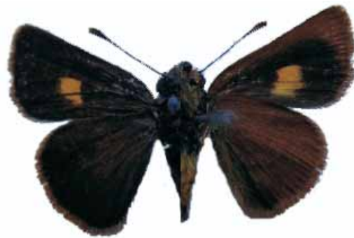
Figura 15. Dallya puracensis quindio Steinhauser, 1991 ♂

CALDAS: Villamaría, Quebrada Pipinta, Vereda Montaña, 2450 m, 4-II-2004, 1 macho (J. I. Vargas Col.) CJIV-067