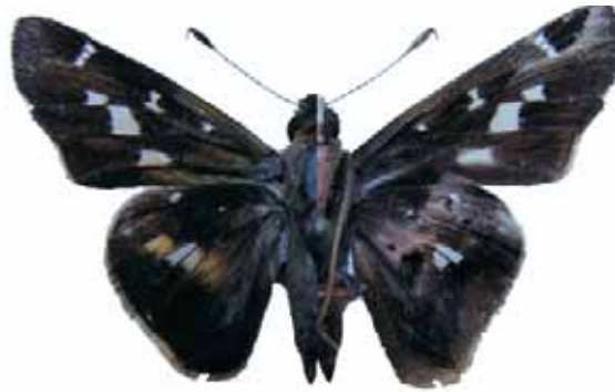
Figura 10. Thespieus dalman (Latreille, 1824) ♂

CALDAS: Belalcazar, Reserva Ecológica Verdes Horizontes, Finca los Carros, 1300 m, 5-IX-2007, 1 macho (J. W. Murillo Col.), 1 hembra (misma localidad y fecha (E. Hena Col.) ambos en CEH-085. Manizales, sector Tres Puertas, sitio Pinares, 1060m, 20-IV-2008, 1 macho (J. I. Vargas Col.) CJIV-067. VALLE DEL CAUCA: El Dovio, río Dovio, Cañón del río Garrapatás, 800 m, 8- IV- 1996, 1 macho (J. A. Salazar Col) CJIV-067.