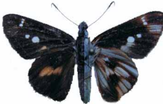
Figura 13. Vettius fantasos fantasos (Cramer, 1780) ♀