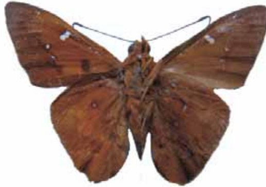
Figura 4. Discophellus porcius porcius (C. Felder & R. Felder, 1862) ♂