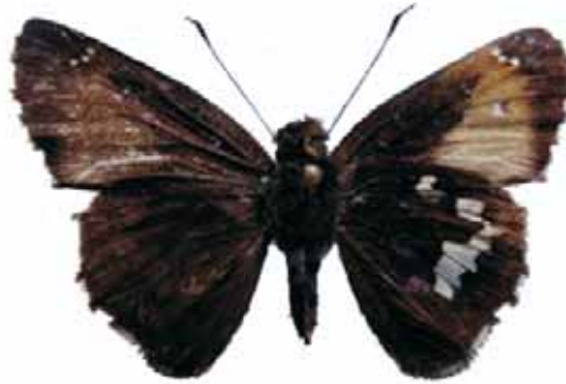
Figura 6. Enosis dognini Mabille, 1889 ♂

de Guaca, Vereda las amarillas, Borde de Bosque, 2600 m, 1 hembra, VII-2005 (R. Oviedo Col.) CEH-085.