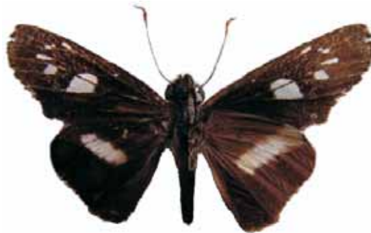
Figura 14. Zenis jebus hemizona (Dyar, 1918) ♂

CALDAS: Villamaria, Vereda el Roble, 2300 m 15-II-2006 2 machos (J.I. Vargas Col) CEH-085