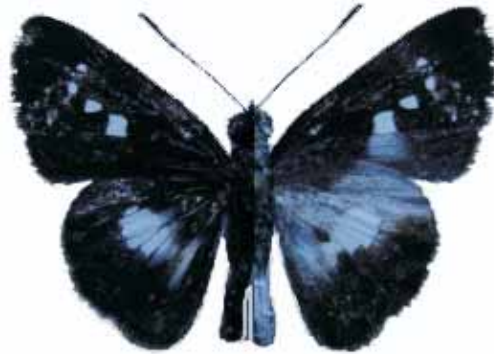
Figura 12. Vettius monacha (Plötz, 1882) ♂

RISARALDA: Quinchia, Irra, Cerro La Cruz, 950 m, 20-VI- 2008, 1 Hembra (J. I. Vargas Col.) CJIV-067.