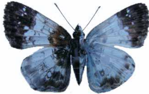
Figura 3. Diaeus lacaena (Hewitson 1860) ♂