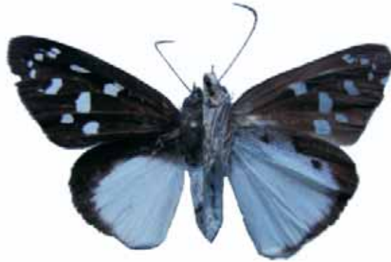
Figura 5. Hyalothyris neleus pemphigargyra (Mabille, 1888) ♀

CALDAS: La Dorada, Charca del Guarinocito, 200 m, 30-VII-2001, 1 hembra (J. I. Vargas Col.) CJIV-067. TOLIMA: Mariquita, La Parroquia, 500 m, 4-I-2003, 1 hembra (J. I. Vargas COL) CJIV-067. CAQUETA: Solano P.N.N. Chiribiquete, 800 m, 7-III- 2001, 1 hembra, colector local en CEH-085.